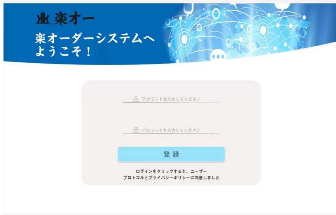
楽オーダーシステム登録画面